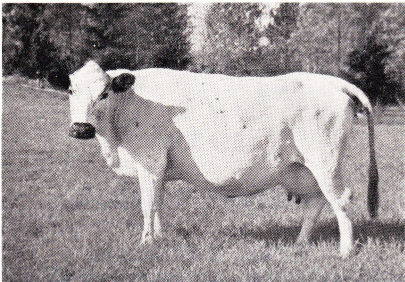
10 Prila 2 A 2843, moder till tjuren 9 Prille SKB 3988